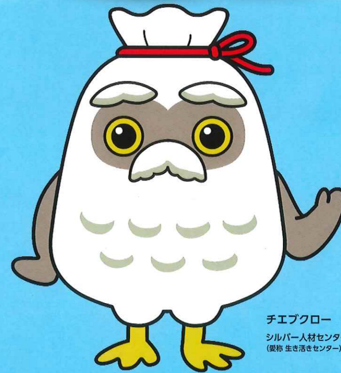
チエブクロー シルバー人材センター (愛称 生きがいセンター)