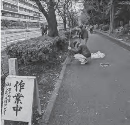
一斉美化奉仕活動の様子

清掃ボランティアについては、今後も活動を行ってまいりますので、皆様のご参加をお待ちしております。