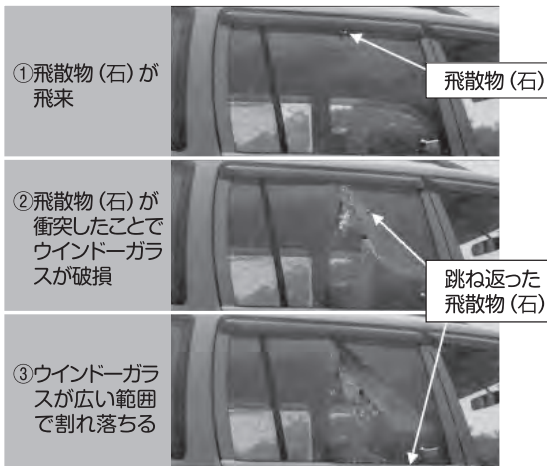
車両ガラス破損の瞬間

また、住居の壁際など、コード類の破損の可能性がある場所や、周囲に破損の危険のあるものが多く、防護ネットで十分に防護出来ないような場所では草刈機を使用しない作業を取りやめ、手作業で作業するよう今一度確認ください。