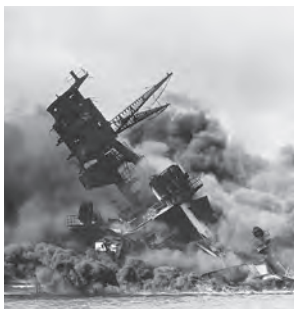
真珠湾攻撃により爆沈した戦艦アリゾナ。この日から、日本は太平洋戦争へ突入していった。

● 相模鉄道の香川台駅が開業される。香川台駅は茅ヶ崎～香川間に設けられた駅であったが、戦時中の1944年の国策による相模鉄道国有化の際に廃止された。